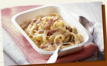
Tagliatelles à la carbonara

パルメザンをたっぷり使用した 滑らかなクリームソースと ベーコンを使った、味わい深い カルボナーラです