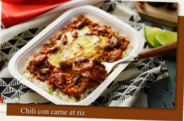
Chili con carne et riz

合挽き肉、玉ねぎ、豆をトマト ソースでピリ辛味に煮込んだ アメリカの国民食です。 バターライスのコクとチーズの まろやかさが相性抜群です