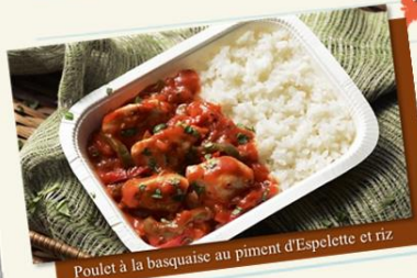
Poulet à la basquaise au piment d'Espelette et riz

チキンやピーマンをじっくり トマトソースで煮込んで エスペレット唐辛子を使った ソースで仕上げたピリ辛で 甘酸っぱい一品です