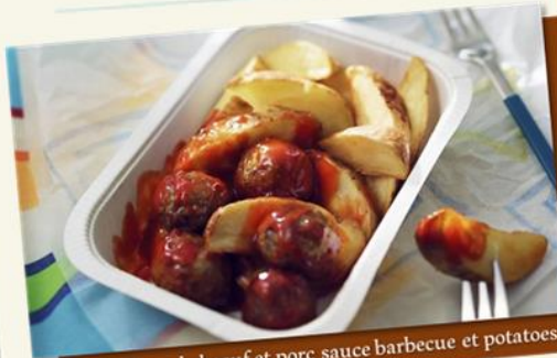
Boulette de boeuf et porc sauce barbecue et potatoes

粗めに挽いたミートボールに スモーク風味を効かせた バーベキューソースをかけて フライドポテトを添えました